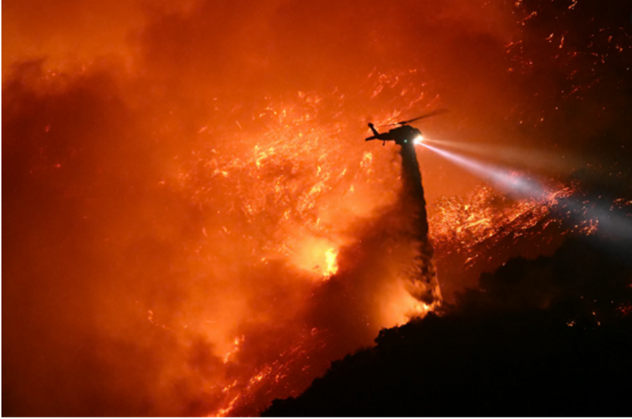
Un hélicoptère lutte contre les incendies à Los Angeles.